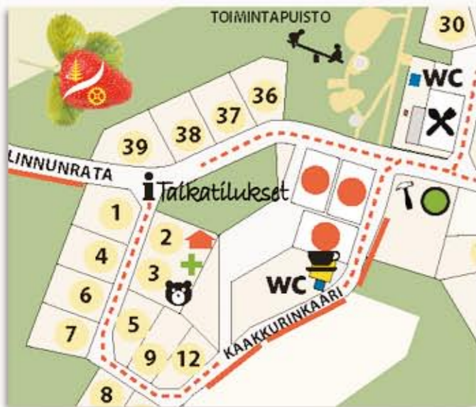
Taikatilukset – Valkeakosken kuvataidekoulun ja käsityökoulun oppilastyönäyttely asuntomessualueella 10.7.-9.8.2009